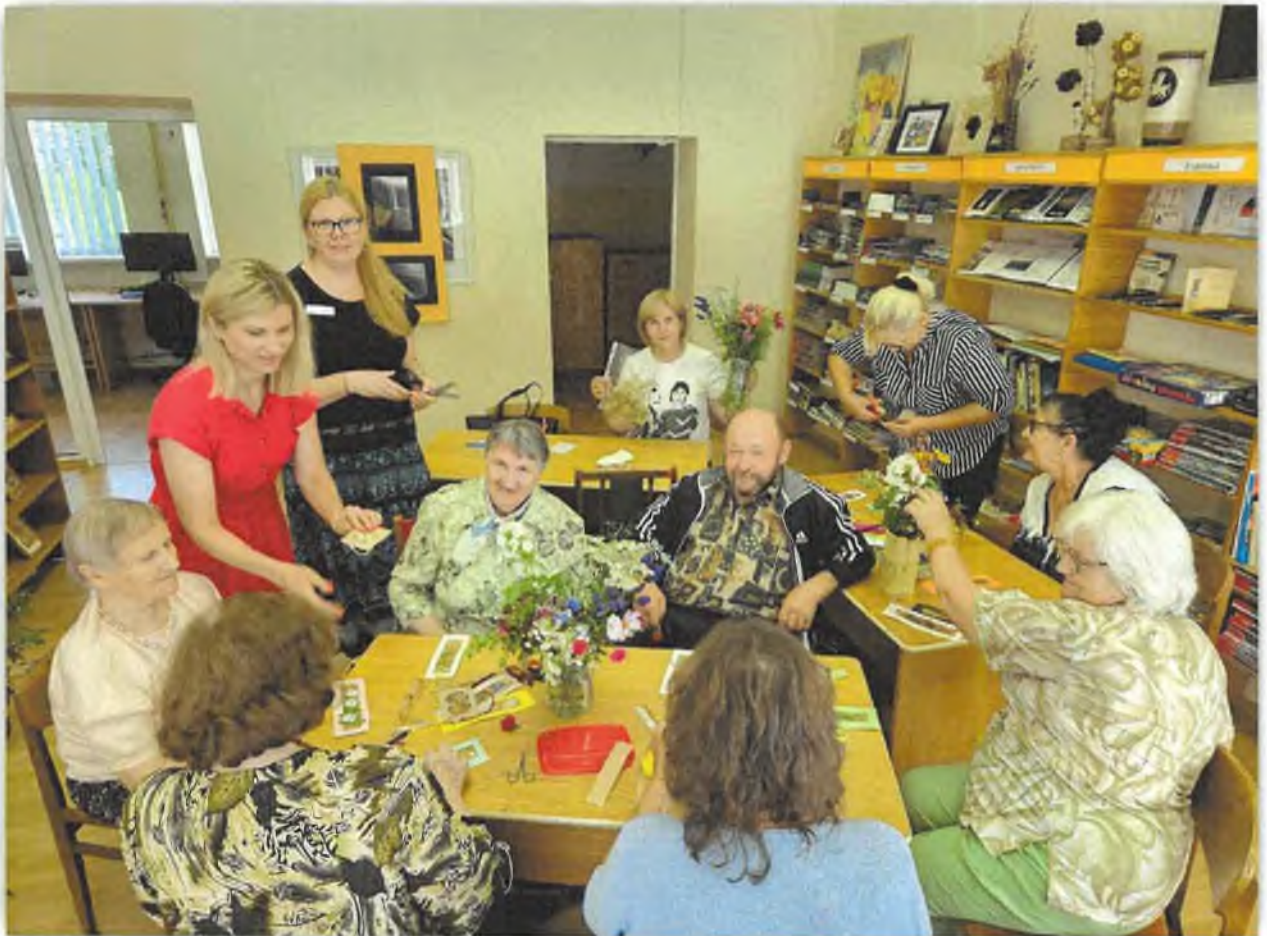
Psichiatrijos dienos stacionare įvairiomis priemonėmis didinama pacientų emocinė gerovė

skatinamosios paslaugos: fiziologinio neštumo priežiūra, naujagimių priežiūra, neįgaliųjų priežiūra, imunoprofilaktika vaikams, moksleivių parengimas mokyklai, slaugytojo paslaugos namuose, vaikų krūminių dantų dengimo silantinėmis medžiagomis, prevencinių programų vykdymas (skatinamosios paslaugos), t.y. priešinės liaukos vėžio ankstyvosios diagnostikos programa; asmenų, priskirtų širdies ir kraujagyslių ligų didelės rizikos grupei, atrankos ir prevencijos priemonių programa, atrankinės mamografinės patikros dėl krūties vėžio programa, gimdos kaklelio piktybinių navikų prevencinių priemonių programa, storosios žarnos vėžio ankstyvosios diagnostikos finansavimo programa.